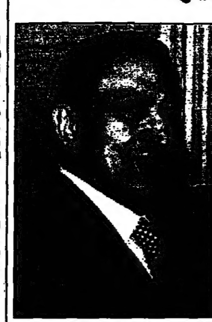
الرئيس حسني مبارك

اسمعت عام 1979 كانت صحيفة اشتركية، الا ان اقرب الحزب لسلطة وشروطه بالمطالبة بتطبيق الديمقراطية في الدولة غير من توجهاتها.